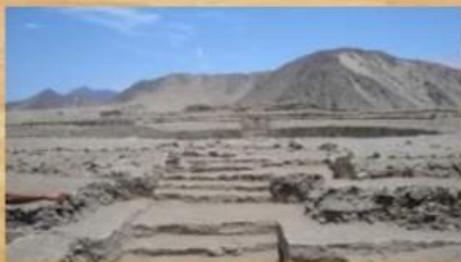
РУИНЫ ДРЕВНЕГО ГОРОДА