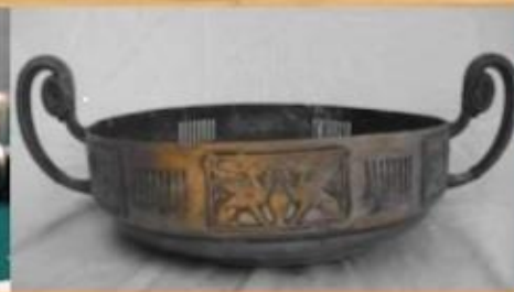
СТАРИННЫЕ ПРЕДМЕТЫ БЫТА

□ О чем могут «рассказать» эти источники?